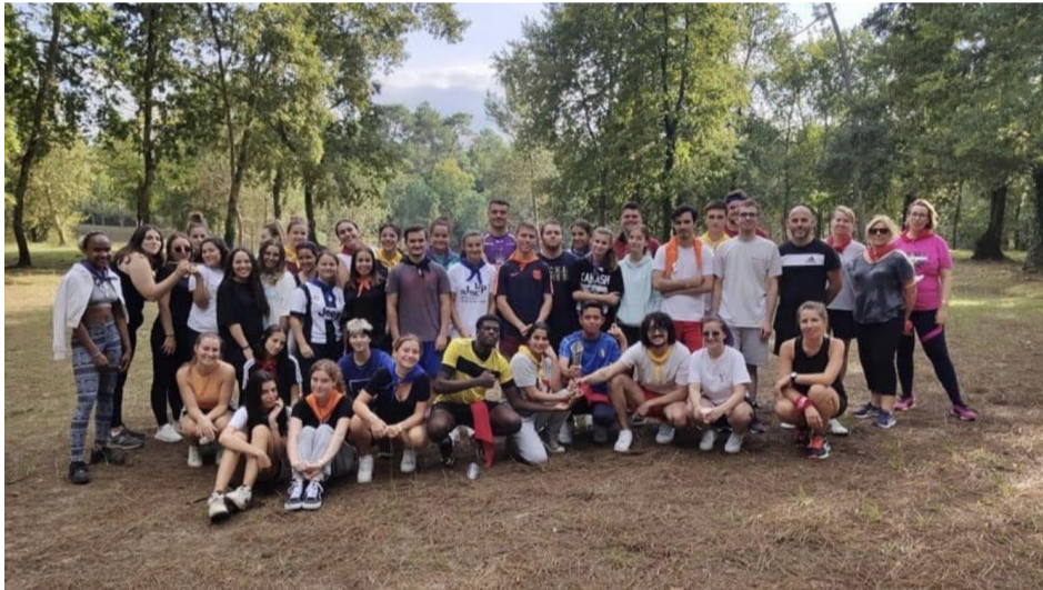
Photo de la clôture de la journée d'intégration 2021-2022

La journée d'intégration des SAM a eu lieu le Jeudi 23 Septembre 2021 au Lac de Ménasse à Saint-Pierre-du-Mont.